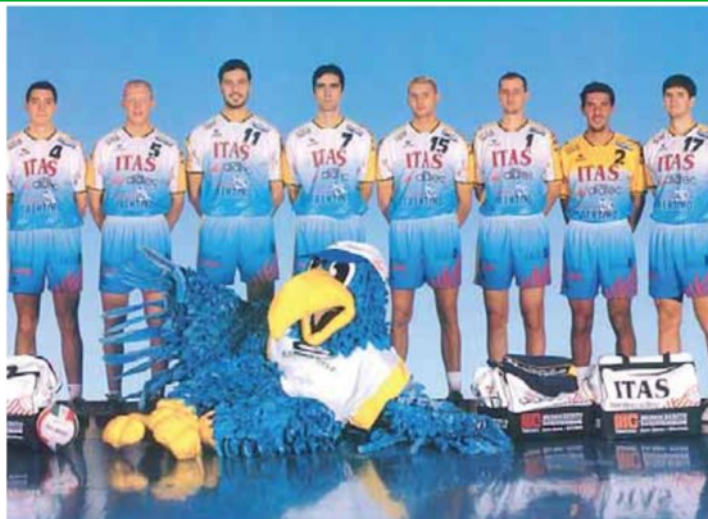
• La foto ufficiale della squadra del campionato 2000-2001