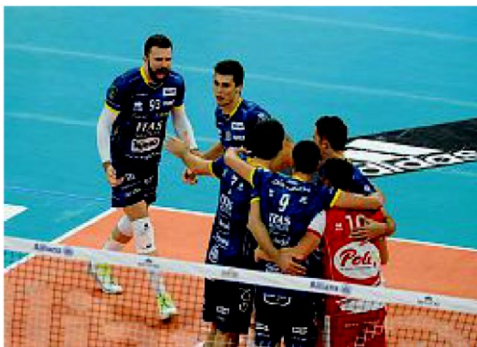
Grinta I giocatori della Itas si abbracciano sotto rete dopo un punto

Turno infrasettimanale con la Kioene Padova alla Blm Group Arena (ore 20.30)