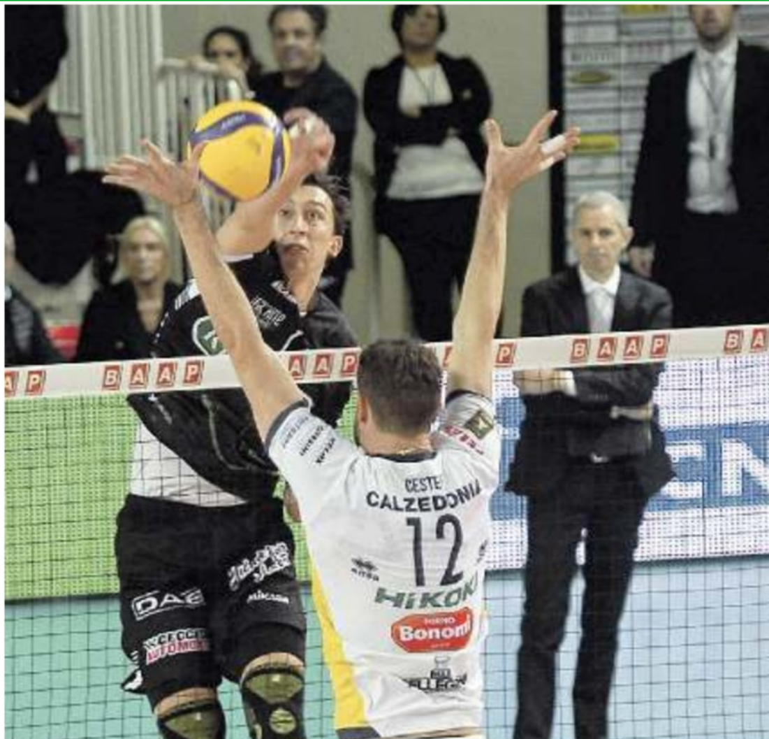
LA PARTITA La Kioene questa sera è attesa da una sfida impossibile a Trento, contro l'Itas